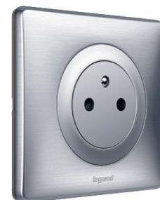
BREVET LEGRAND PRISE CÉLIANE™ SURFACE

Avec son design à fleur de mur qui garantit propreté et sécurité, Céliane Surface est le nouveau standard de la prise de courant. Et elle est au même prix que la prise standard !